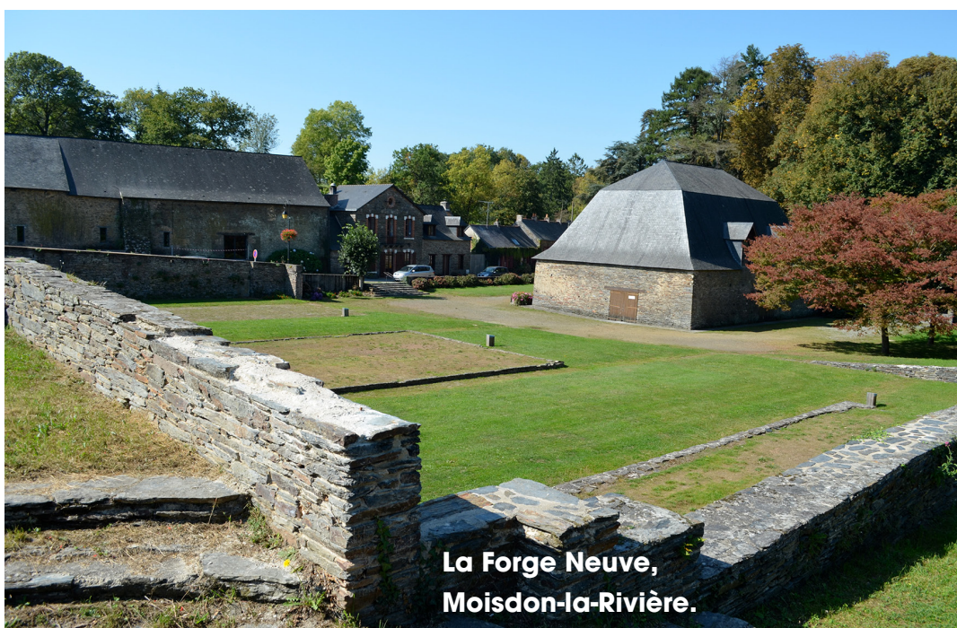
La Forge Neuve, Moisdon-la-Rivière.

Invitation à la découverte du patrimoine du territoire, «Divas du Jazz» fera la part belle au plein air, sur la promenade du Duc d'Aumale aux abords du château ainsi que dans les rues et places du centre historique de Châteaubriant avant de se prolonger, dimanche 3 juillet, à la Forge Neuve de Moisdon-la-Rivière.