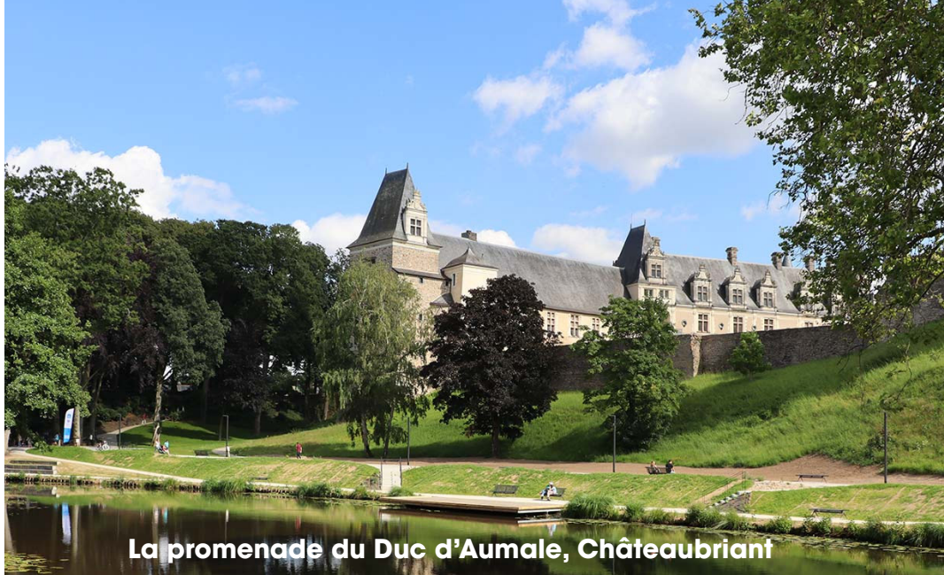
La promenade du Duc d'Aumale, Châteaubriant