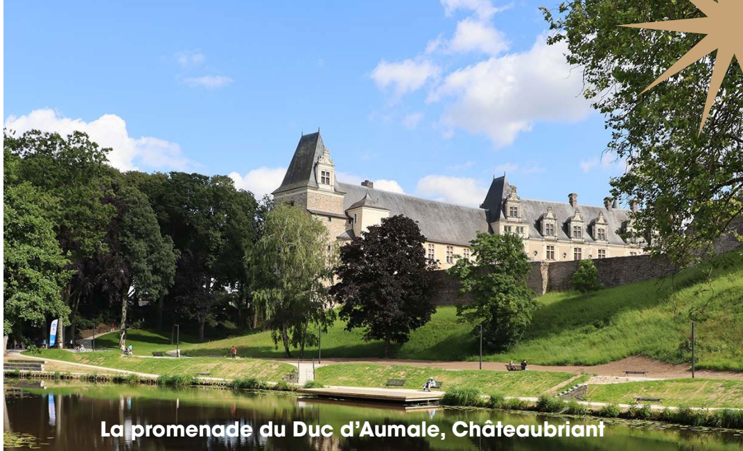
La promenade du Duc d'Aumale, Châteaubriant